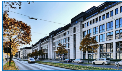
Fürstenwall 25, MAGS, Quelle: https://www.mags.nrw/

Das Gremium besteht aus Expertinnen und Experten aus Wissenschaft, Bildung, Gesundheitspolitik, Krankenhäusern NRW, Ärztekammern NRW: ÄKNO und ÄKWL, Alzheimer Gesellschaften, Krankenhausgesellschaft NRW